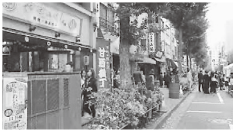
視察先の甘酒横丁風景