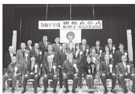
各団体の納税表彰受賞者 集合写真