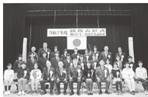
税に関する作文・絵はがき 受賞者集合写真