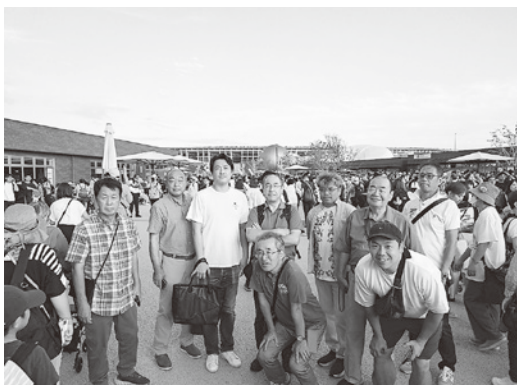
大子地区会の先進地視察研修会の模様