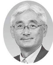
一般社団法人 太田法人会