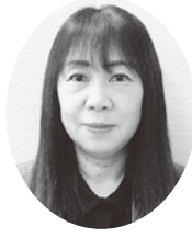
茨城県常陸太田県税事務所