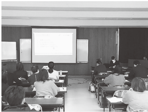
多くの受講者が参加した年末調整説明会