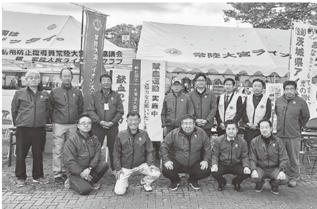
大宮地区会での献血活動の様子