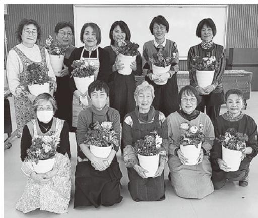
寄せ植え講習会に参加した女性部会員

寄せ植え講習会に参加した女性部会員ちよつと淋しいこの季節、少しでも華やかにお正月をお迎えするために参加された11名は先生の指導のもと、花材一つ一つの重要な根っこの処理を丁寧に時間をかけて行い、皆さん楽しそうに思い思いの寄せ植えを作成されました。参加された皆さんは完成した作品を眺めながらお互いの作品の良いところを称賛し、とても和やかなひとときになりました。