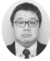
関東信越税理士会太田支部

結びに、本年が太田法人会様、あわせて会員の皆様の実り多き素晴らしい一年になりますことを心よりお祈り申し上げます。新年のご挨拶とさせていただきます。