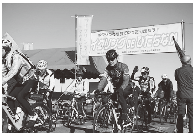
国営ひたちなか海浜公園を出発する参加者たち