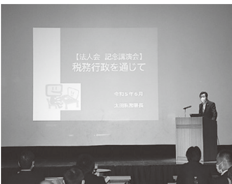
太田税務署長講演会