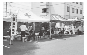
かわねやフェスタ店駐車場の献血会場

当日は、太田法人会の会員をはじめ、一般の方々にもお越しいただき、申込者48名のうち43名の方々から採血いただきました。